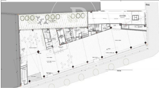
PLANTA BAJA 489,08 m 2