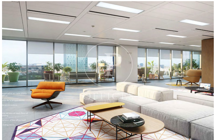
La terraza en cada planta oficinas de la propia planta de la oficina de la oficina