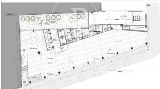
PLANTA TIPO 300 - 700 m 2