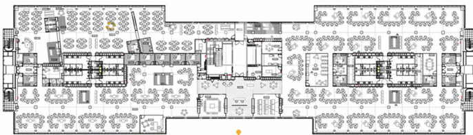
Planta CUARTA AMUEBLADA